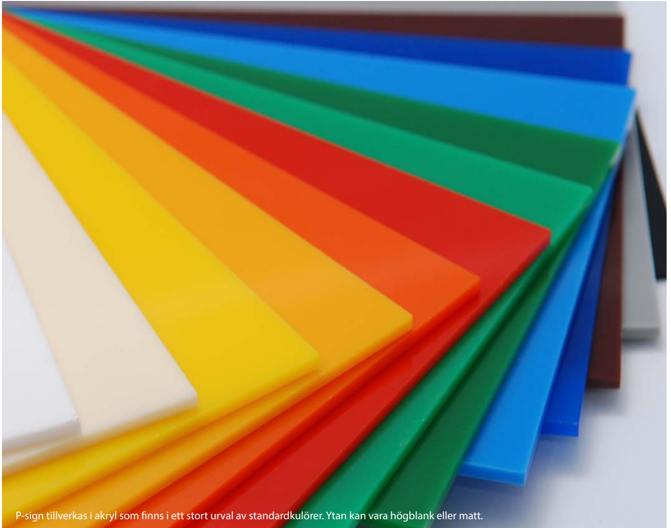
P-sign tillverkas i akryl som finns i ett stort urval av standardkulörer. Ytan kan vara högblank eller matt.