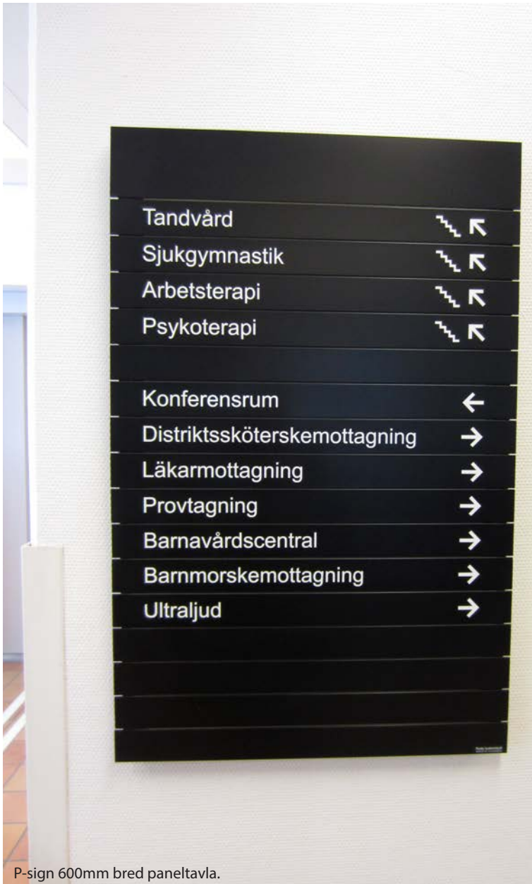
P-sign 600mm bred paneltavla.