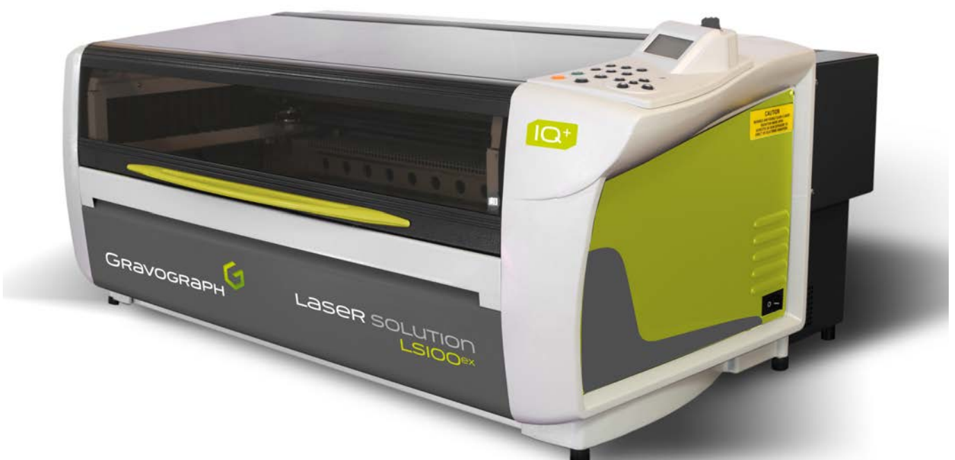
I vår fabrik tillverkar vi panelerna till P-sign i vår LS100EX, en av de största och kraftigaste lasermaskinerna på marknaden.