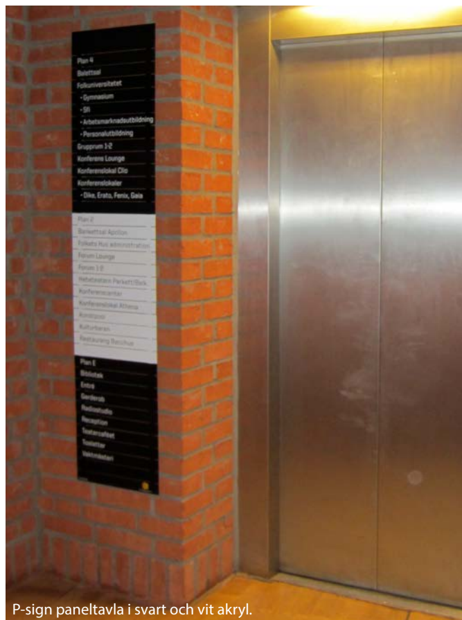
P-sign paneltavla i svart och vit akryl.

Mer information finns på vår hemsida www.systemskylt.se